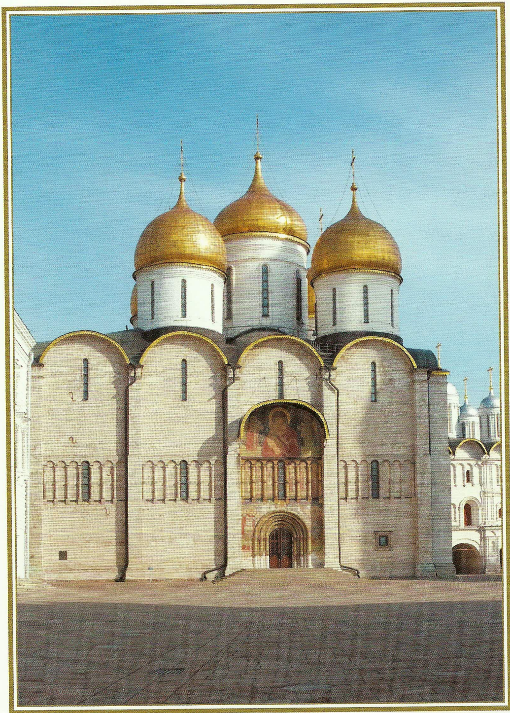
УСПЕНСКИЙ ПАТРИАРШИЙ СОБОР МОСКОВСКОГО КРЕМЛЯ