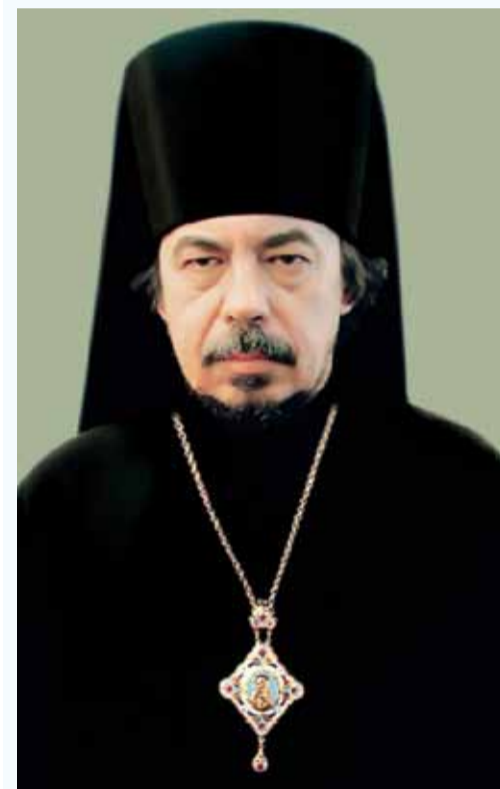
Викария Санкт-Петербургской епархии епископа Петергофского Маркелла – с днём тезоименитства.