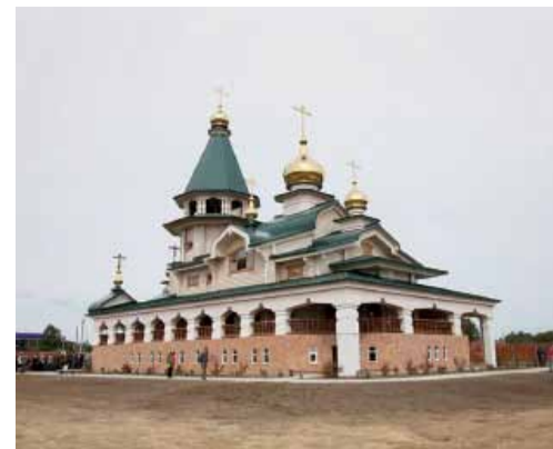
Освящение храма в честь св. блгв. кн. Александра Невского. С. Троицкое, о. Сахалин. 20.09.2010.

Также Святейший Патриарх встретился с журналистами Патриаршего пула и ответил на вопросы корреспон-