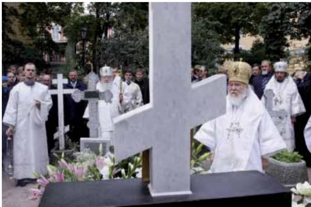
Лития на могиле митрополита Никодима. 5 сентября 2010 г.