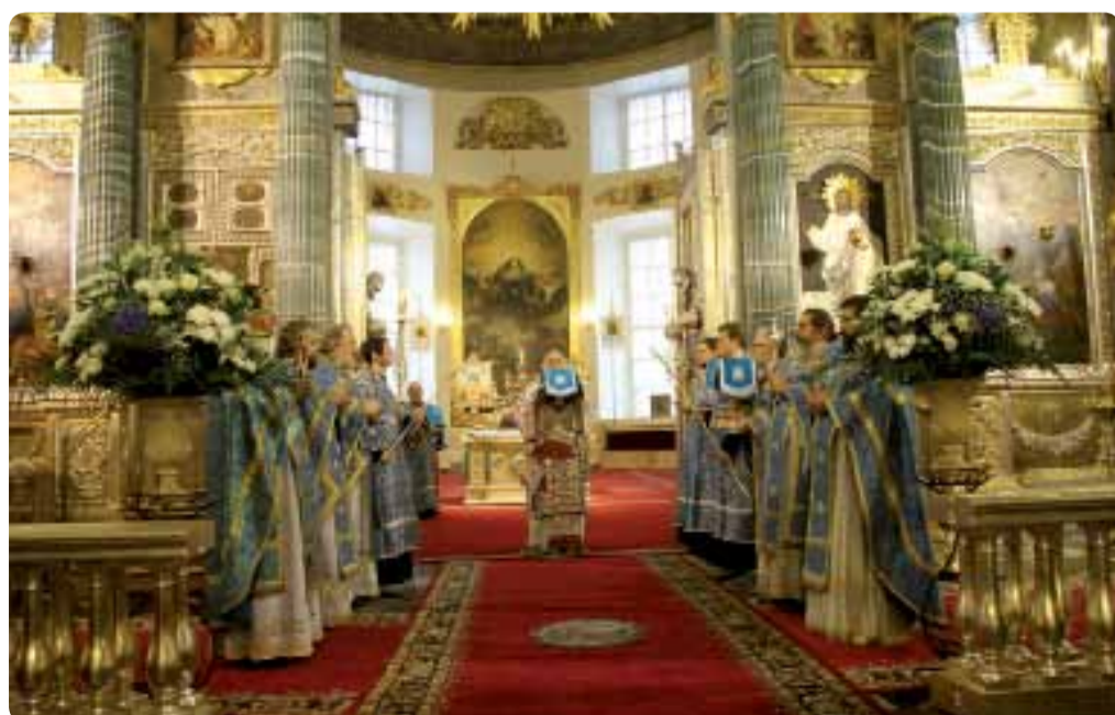
Праздник Рождества Пресвятой Богородицы. Божественную литургию в Казанском кафедральном соборе совершил митрополит Керкиры, Пакси и Диапонтийских островов Нектарий (Элладская Православная Церковь) 21 сентября 2010 г.