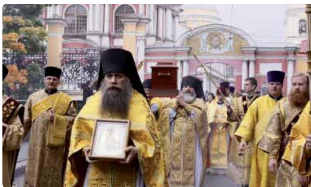
Празднование памяти св. блгв. князя Александра Невского. Александро-Невская лавра. 12 сентября 2010 г.