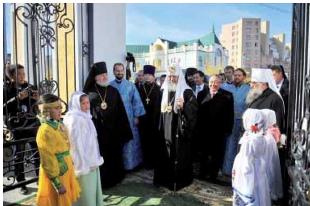
Посещение кафедрального Спасо-Преображенского собора г. Якутска. 23 сентября 2010 г.

Официальный сайт Московского Патриархата