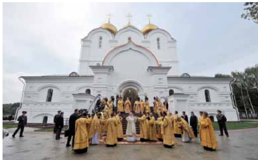
Великое освящение Успенского собора г. Ярославля. 12.09.2010 г.

Мне бы хотелось пожелать также помощи Божией духовенству города Мышкина в осуществлении пастырского служения. Благодарю Вас, владыка, за заботу об этом граде, за восстановление храмов. Я очень надеюсь, что в следующий раз, когда я приеду в Мышкин, Успенский кафедральный собор будет блистать не только внешними своими отреставрированными стенами, но и внутри будет полное благолепие и красота. Хотя и в таком храме молиться тоже очень необходимо, потому что эти стены напоминают нам еще о совсем недавнем прошлом. Они как раны на теле человека, свидетельствующие о том, что человек прожил тяжелую жизнь. Так и наши храмы на теле Русской Церкви свидетельствуют о нашей тяжелой жизни. Когда залечим эти раны, многие даже не поверят, что прошел наш народ через такие трудности и духовные испытания. Но дай Бог, чтобы раны залечивались, восстанавли-