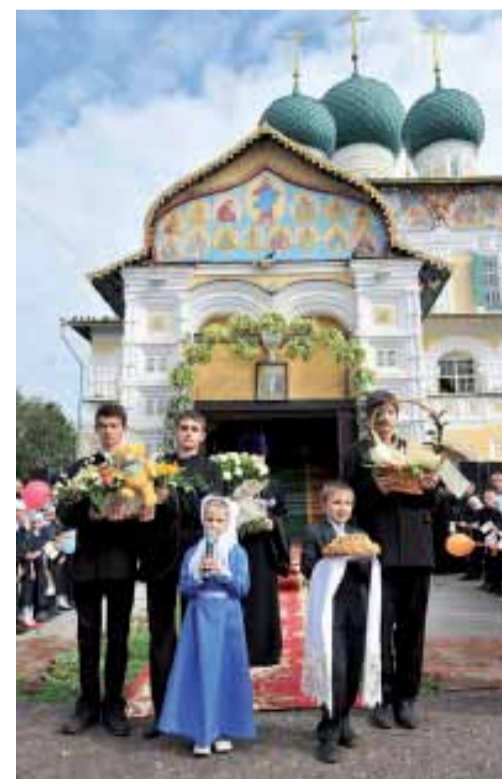
Встреча Патриарха Кирилла. Воскресенский собор г. Тутаева. 11 сентября 2010 г.