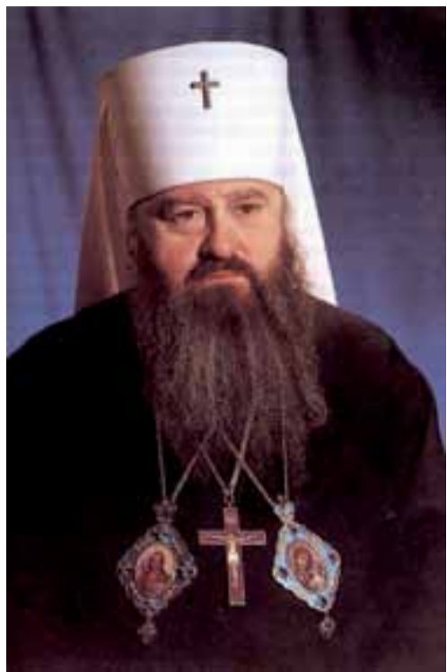
Митрополит Ленинградский и Новгородский Никодим, Патриарший Экзарх Западной Европы

В 2010 году, 5 сентября, как и во все годы со дня кончины митрополита Ленинградского и Новгородского Никодима (Ротова; 12. 10. 1929 – 5. 09. 1978), в Санкт-Петербург прибыли митрополит Крутицкий и Коломенский Ювеналий, архиереи и многочисленное духовенство из других городов почтить память выдающегося иерарха Русской Православной Церкви.