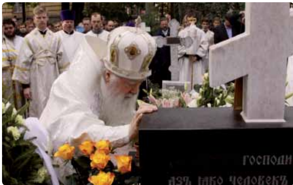
Лития на могиле митрополита Никодима. 5 сентября 2010 г.