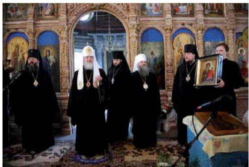
Посещение Успенского собора города Мышкин. 9 сентября 2010 г.

С 9 по 12 сентября 2010 года состоялся Первосвятительский визит Святейшего Патриарха Московского и всея Руси Кирилла в Ярославскую и Ростовскую епархию.