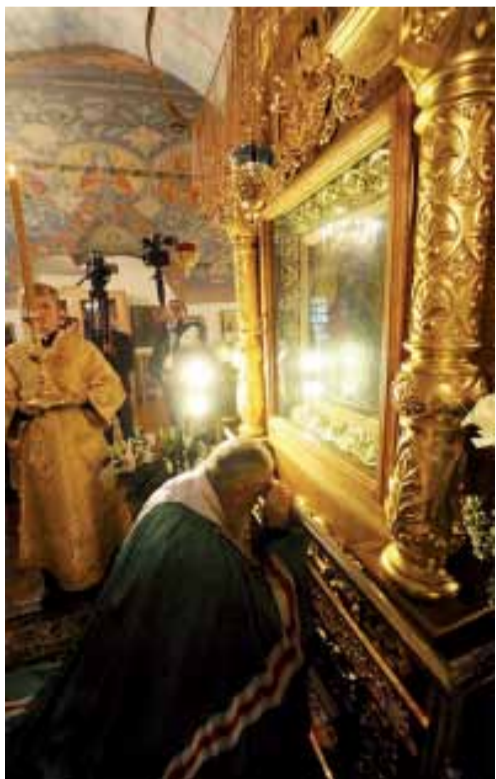
Перед чудотворной Толгской иконой Пресвятой Богородицы. 11.09.2010 г.

ским актом, совершенным в этот день во Владикавказе. «Россия страдает от терроризма, – сказал Святейший Патриарх. – Это война, которая уносит жизни невинных людей, война, направленная на