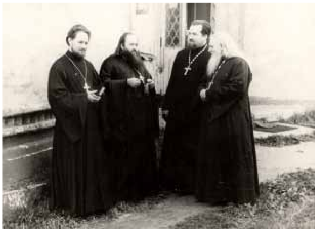
У стен Феодоровского собора Ярославля. 1958 год.

Одним из таких близлежащих храмов был храм в селе Давыдово на другом берегу Волги, где в начале своего священнического служения нес послушание молодой иеромонах