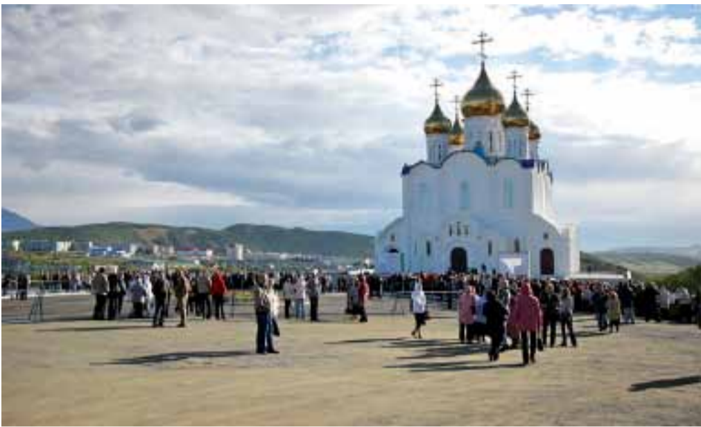
Великое освящение Троицкого кафедрального собора г. Петропавловска-Камчатского.

С 16 по 25 сентября 2010 года состоялся Первосвятительский визит Святейшего Патриарха Московского и всея Руси Кирилла на Дальний Восток.