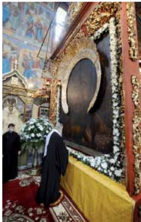
Посещение Воскресенского собора города Тутаева. 11 сентября 2010 г.

Я хотел бы всем вам, мои дорогие, пожелать помощи Божией на путях вашей жизни, пожелать сил для хранения веры в сердце, пожелать мудрости и разумения для того, чтобы в этой вере воспитывать своих детей и внуков. Вот тогда и культурная традиция, запечатленная во внешнем облике города Мышкина, будет живой традицией, ибо она будет передавать основные ценности нашего народа.