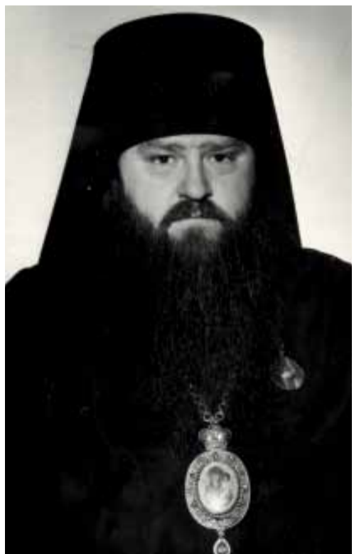
Никодим, архиеп. Ярославский и Ростовский. 1962 год.

Воскресную Божественную литургию в Свято-Троицком соборе Александро-Невской Лавры совершал митрополит Ювеналий в сослужении архиепископа Брюссельского и Бельгийского и временно Гаагского и Нидерландского Симона, архиепископа Симбирского и Мелекесского Прокла, архиепископа Новгородского и Старорусского Льва и викариев Санкт-Петербургской епархии – рек-