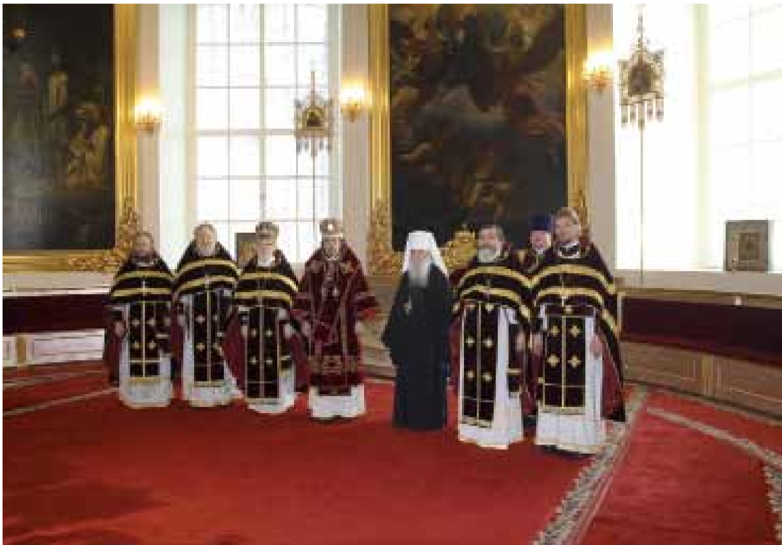
Казанский собор. 27 сентября 2010 г.