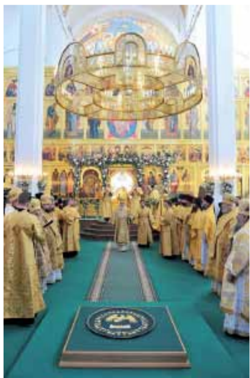
Троицкий собор г. Петропавловска-Камчатского. 19 сентября 2010 г.

«Я очень хочу познакомиться с жизнью малых народов Севера, — добавил Предстоятель. — В XIX веке Русская Православная Церковь делала очень много для миссии среди коренных народов Дальнего Востока России. Затем наступили тяжелейшие для жизни Церкви годы. Но сегодня вновь возникает возможность лицом