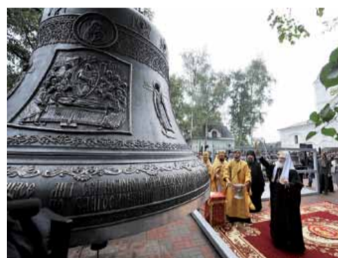
Освящение колоколов Успенского собора г. Ярославля.