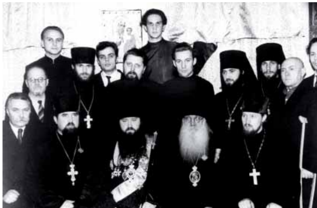
В Ярославском Епархиальном управлении. 1962 год.

В 1952 – 1955 гг. он заочно учится в Ленинградской Духовной Семинарии (вместо четырех лет окончил её