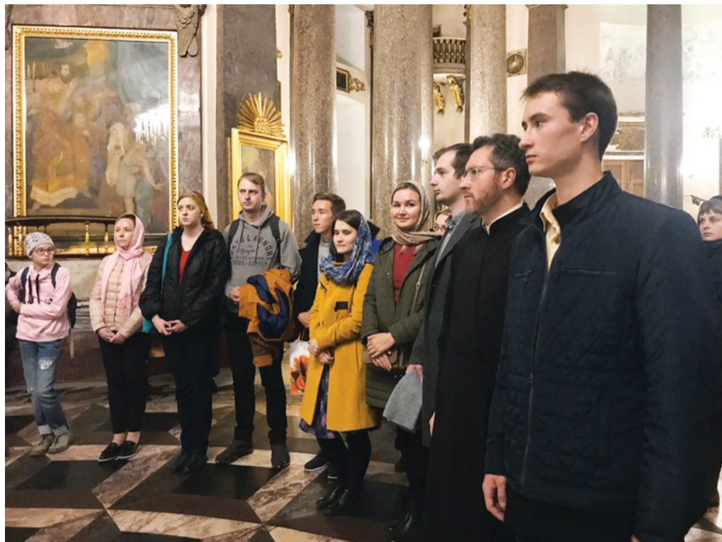
19 сентября 2019 года в православном молодежном клубе Казанского кафедрального собора «Встреча будущего» прошла встреча с обсуждением дискуссионной темы «Роль женщины в Церкви». Перед началом встречи для участников клуба была организована экскурсия по собору.