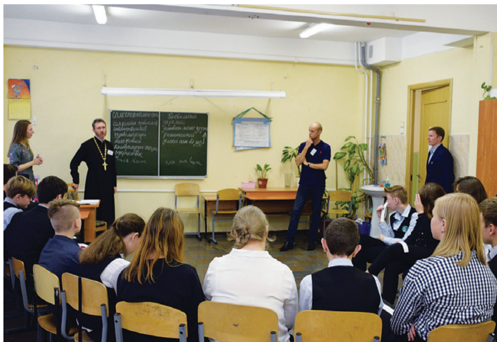
28 сентября 2019 года состоялась молодежная конференция «Наши приоритеты в современном мире» для старшеклассников 385-й общеобразовательной школы СПб. Конференцию организует отдел по делам молодежи, эта – уже 93-я по счету. Школьники в интерактивной форме обсудили проблемы взаимоотношений поколений, отношений молодого человека и девушки, карьеры и образования, здоровья и спорта. В конференции приняли участие опытные эксперты. В конце ребята по итогам представили творческие выступления