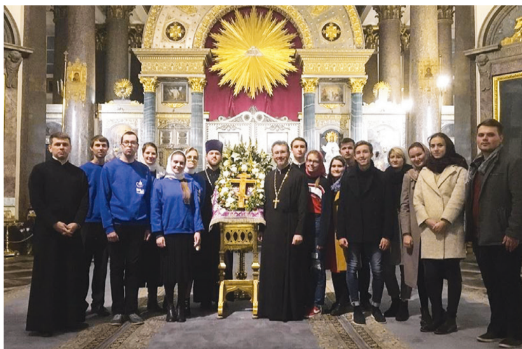
26 сентября 2019 г. Участники молодежного Добровольческого движения Казанского кафедрального собора по завершении всенощного бдения, совершенного митрополитом Варсонофием.