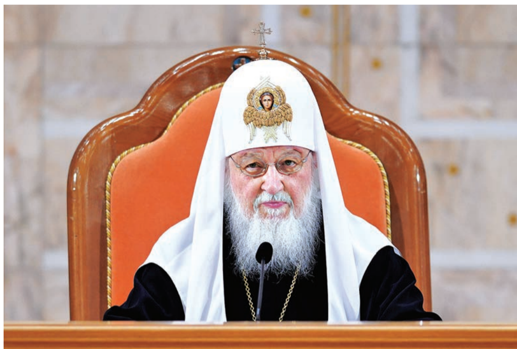
27 марта 2024 года Святейший Патриарх Московский и всея Руси Кирилл выступил на внеочередном соборном съезде Всемирного русского народного собора.

Три дня назад мы вспоминали трагическую дату: 24 марта исполнилось 25 лет с начала военной агрессии НАТО против суверенной Югославии и массивной бомбардировки Белграда. В то время я был в Белграде и своими глазами видел эти бомбардировки. Я остановился в гостинице, которая располагалась несколько выше, чем центр города, и с гостиничной террасы мне было видно всё. Никогда