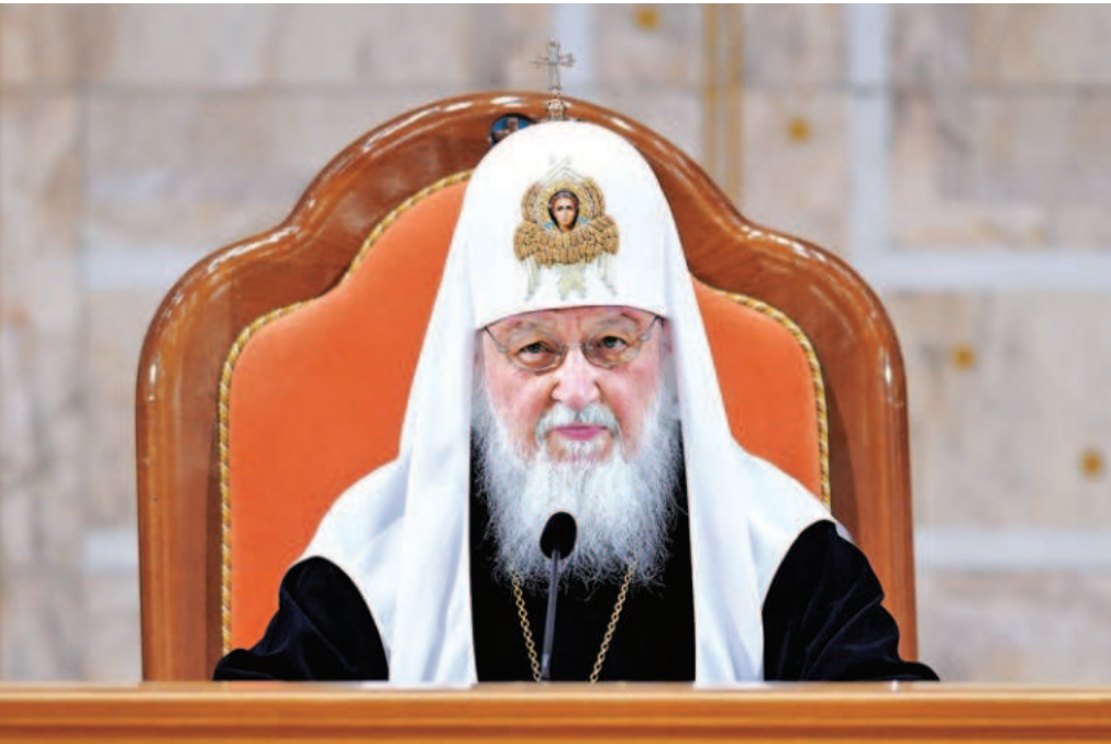
27 марта 2024 года Святейший Патриарх Московский и всея Руси Кирилл выступил на внеочередном соборном съезде Всемирного русского народного собора.

Три дня назад мы вспоминали трагическую дату: 24 марта исполнилось 25 лет с начала военной агрессии НАТО против суверенной Югославии и массированной бомбардировки Белграда. В то время я был в Белграде и своими глазами видел эти бомбардировки. Я остановился в гостинице, которая располагалась несколько выше, чем центр города, и с гостиничной террасы мне было видно всё. Никогда