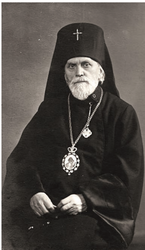
Архиепископ Григорий (Чуков)