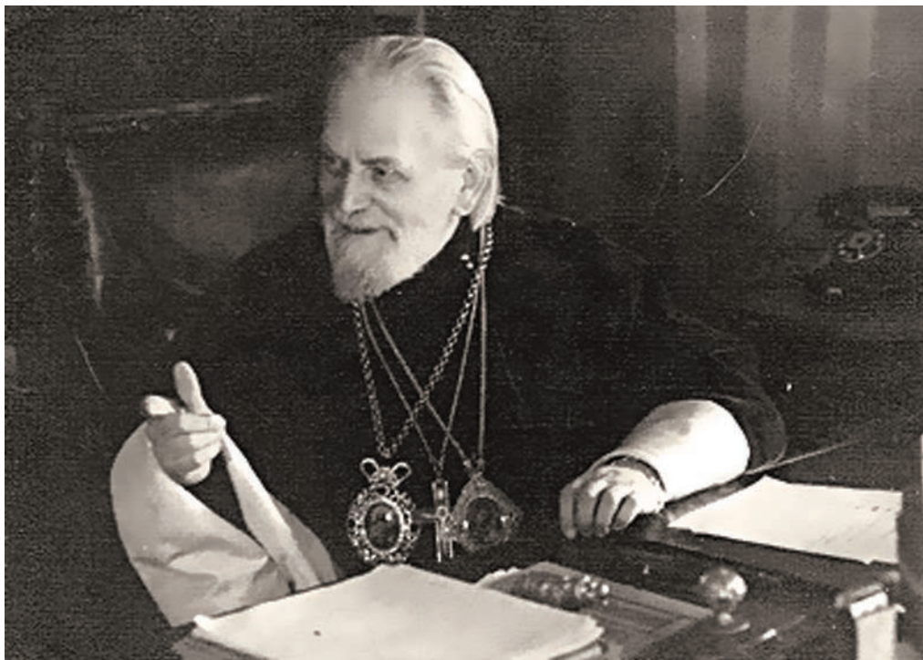
Митрополит Григорий (Чуков)

В январе 1949 г. митрополит Григорий добился разрешения Ленгорисполкома на занятие Духовского корпуса лавры для размеще-