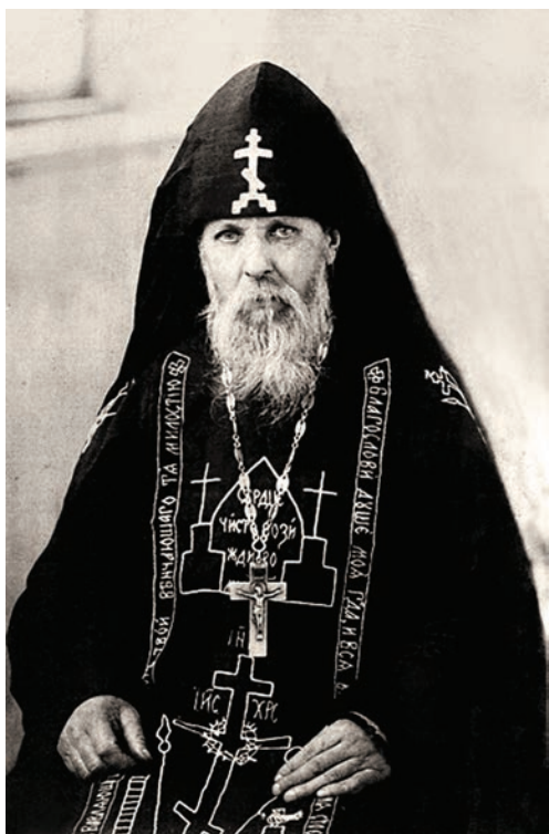
Иеросхимонах Серафим Вырицкий

К 25-летию прославления преподобного и 70-летию кончины митрополита (05.11.1955)