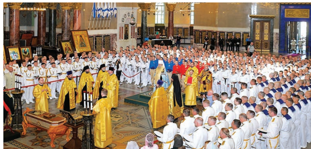
Принесение мощей св. прав. воина Феодора в Морской собор Кронштадта

Имя Федора Ушакова навсегда вписано в героическую историю Военно-морского флота России. Адмирал одержал яркие победы в 43 морских сражениях, не потерпев ни единого поражения. Ни один его матрос не попал в плен. Своими победами над турками закрепил за Россией Крым, внес особый вклад в школу военно-морского искусства, в создание Черноморского флота и устройство Севастополя, в освобождение Ионических островов и создание первой греческой конституции нового времени. Отличался милосердием к пленным, делами благотворительности, благочестием. Не будучи никогда женат, последние годы провел рядом с Санакарским монастырем, ведя образ жизни, близкий к монашескому. В честь 15-летия канонизации святого праведного воина адмирала Феодора Ушакова впервые с 6 августа по 1 сентября 2016 года состоялось принесение его мощей из Санакарского монастыря, что в Мордовии, – места их постоянного пребывания – в города, связанные с жизнью и подвигами великого святого. Городов этих девять: Рыбинск, Санкт-Петербург, Воронеж, Ростов-на-Дону, Краснодар, Новороссийск, Керчь, Симферополь и Севастополь. Значительная часть жизни адмирала связана с Санкт-Петербургом – морской столицей нашей родины. В преддверии праздника 30 августа, когда в День ВМФ проводится Главный военно-морской парад, раку с мощами святого, принесенную из Санакарского мужского монастыря, встречают в Морском соборе Кронштадта, храме морской воинской славы России.