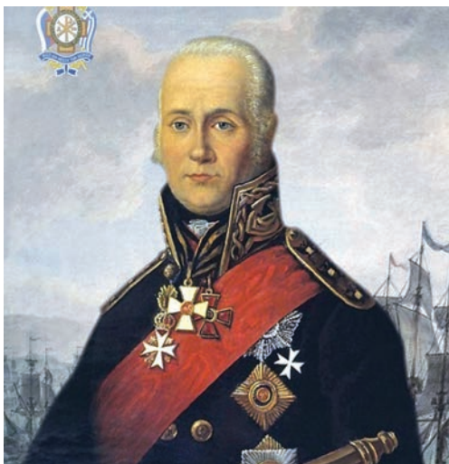
Св. прав. воин Феодор Ушаков

Двадцать четыре года назад знаменитый русский адмирал Федор Ушаков, родившийся 280 лет тому назад, стал святым праведным воином Феодором, и с тех пор день его преставления ко Господу 15 октября по новому стилю стал днем его памяти. 5 августа 2001 года Феодор Ушаков (13/26.02.1745–2/15.10.1817) был канонизирован Русской