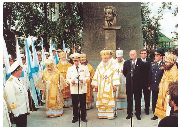
Торжества, посвященные канонизации Феодора Ушакова. 4–5 августа 2001 г.

Имя Федора Ушакова навсегда вписано в героическую историю Военно-морского флота России. Адмирал одержал яркие победы в 43 морских сражениях, не потерпев ни единого поражения. Ни один его матрос не попал в плен. Своими победами над турками закрепил за Россией Крым, внес особый вклад в школу военно-морского искусства, в создание Черноморского флота и устройство Севастополя, в освобождение Ионических островов и создание первой греческой конституции нового времени. Отличался милосердием к пленным, делами благотворительности, благочестием. Не будучи никогда женат, последние годы провел рядом с Санакарским монастырем, ведя образ жизни, близкий к монашескому. В честь 15-летия канонизации святого праведного воина адмирала Феодора Ушакова впервые с 6 августа по 1 сентября 2016 года состоялось принесение его мощей из Санакарского монастыря, что в Мордовии, – места их постоянного пребывания – в города, связанные с жизнью и подвигами великого святого. Городов этих девять: Рыбинск, Санкт-Петербург, Воронеж, Ростов-на-Дону, Краснодар, Новороссийск, Керчь, Симферополь и Севастополь. Значительная часть жизни адмирала связана с Санкт-Петербургом – морской столицей нашей родины. В преддверии праздника 30 августа, когда в День ВМФ проводится Главный военно-морской парад, раку с мощами святого, принесенную из Санакарского мужского монастыря, встречают в Морском соборе Кронштадта, храме морской воинской славы России.