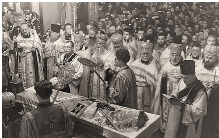
Похороны митрополита Григория (Чукова)

Подробнее статью Лидии Константиновны, правнучки митр. Григория, см: https://ruskline.ru/analitika/2025/08/20/starcy_i_arhierei