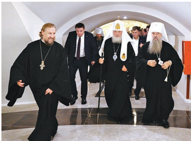
Святейший Патриарх Кирилл осматривает отреставрированные помещения крипты Казанского собора, 2019