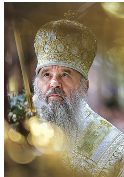
«Горé имеем сердца́», 2017