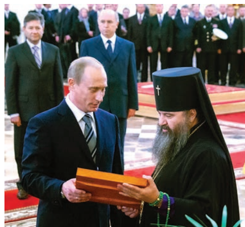
Кафедральный собор святого праведного воина Феодора Ушакова. 11 августа 2006 г.