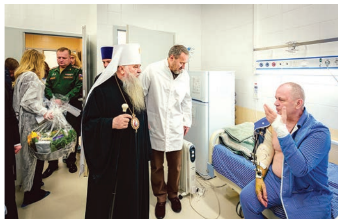
Посещение Военно-медицинской академии, 2025