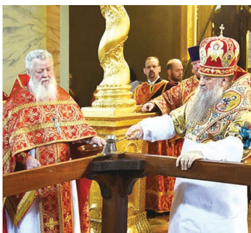
Освящение Петропавловского собора, 2015

«С 2014 года количество храмов в городе на Неве увеличилось на треть. Под вашим личным руководством был открыт 91 приход, и теперь их в Санкт-Петербурге почти триста», – об этом упомянул губернатор северной столицы Александр Беглов,