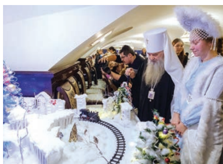
Владыка знакомится с творчеством воспитанников воскресной школы, 2025