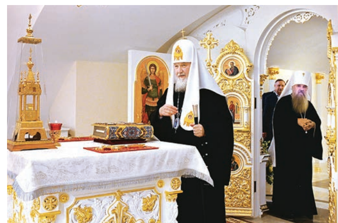
Святейший Патриарх Кирилл в храме сщмч. Ермогена, Патриарха Московского, в крипте собора, 2019

Митрополит Варсонофий, подводя итоги 2025 года в жизни Санкт-Петербургской епархии, в завершение своего доклада на Епархиальном годовом собрании 16 декабря обозначил памятные даты 2026 года, прежде всего юбилеи Святейшего Патриарха Кирилла, имеющие особое значение для всей Русской Православной Церкви и Санкт-Петербургской епархии. Мы будем 20 ноября праздновать восьмидесятилетие Святейшего Патриарха Московского и всея Руси Кирилла, 1 сентября и 14 октября восьмидесятилетие со дня возрождения Санкт-Петербургских (в 1946 году – Ленинградских) духовных школ, 14 марта пятидесятилетие со дня архиерейской хиротонии Его Святейшества, Святейшего Патриарха Кирилла. Эти даты имеют особое значение для нас, как для чад Русской Православной Церкви, так и в силу отеческого внимания, которое наш Предстоятель уделяет как духовным школам своего родного города, так и оказывая помощь в решении проблем Санкт-Петербургской епархии и митрополии.