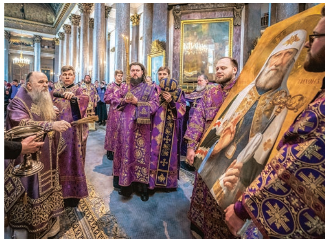
Освящение иконы святителя Тихона, патриарха Московского и всея Руси, 2025