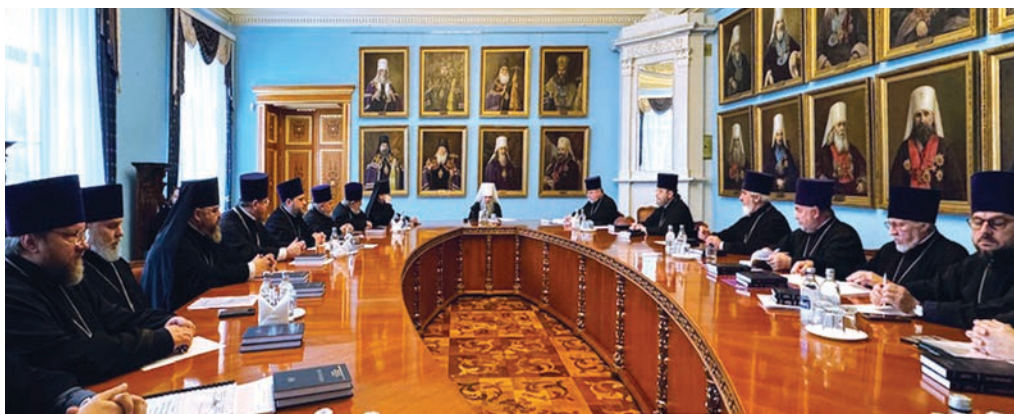
Заседание епархиального совета, 2024