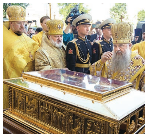
Встреча мощей свт. Николая Чудотворца, 2017