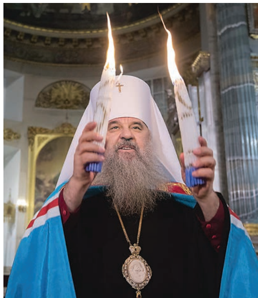
Пасха Христова, 2017