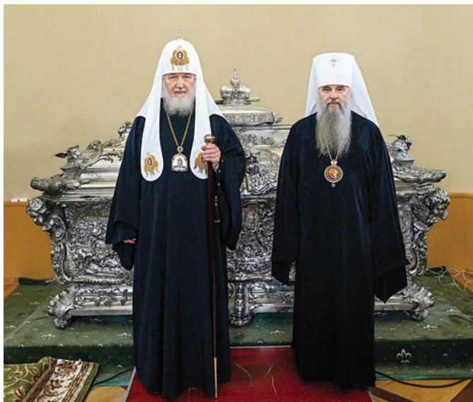
Ураки с мощами св. благ. кн. Александра Невского, 2023