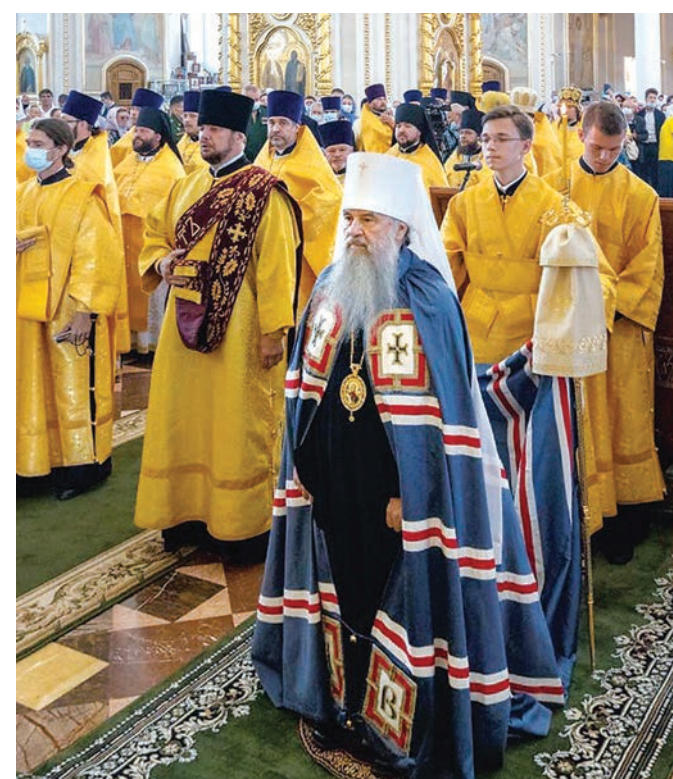
Божественная литургия в Саранске, 2021