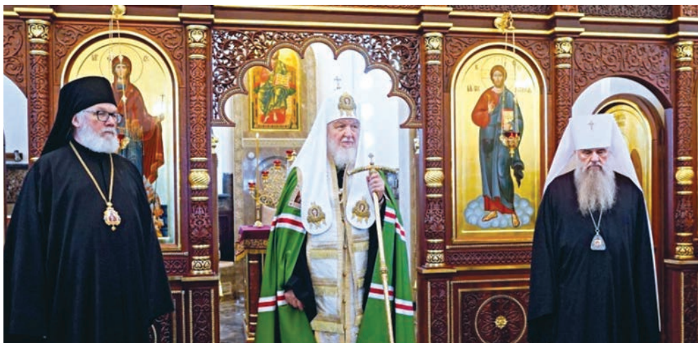
Освящение Андреевского храма на о. Валаам, 2023