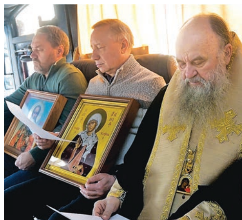
Молитвенный обезд Санкт-Петербурга, 2024

поздравляя 3 июня 2025 года митрополита Варсонофия с 70-летием по окончании Божественной литургии в историческом Казанском соборе города.