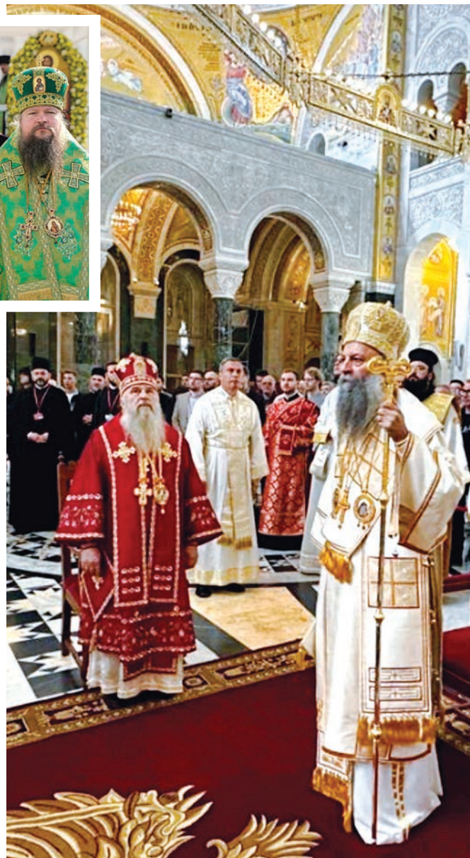
Божественная литургия в Белграде, 2024