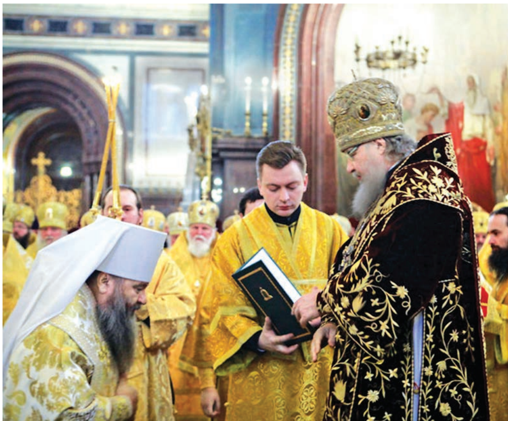
Возведение в сан митрополита

Владыка, отвечая на вопросы журналистов, сказал: «Я прибыл в Санкт-Петербург с большим духовным волнением и трепетом. Начальник Церкви отличается от начальника в мирской жизни. Мы все пастыри, как пастухи, должны заботиться об овцах, чтобы они были сыты духовно и находились в безопасности. Опираясь на этот посох, мы должны как бы опираться на Евангелие и призывать людей жить по Евангелию. Это самая главная наша задача – благовествовать Слово Божие народу Божию. Все мы составляем Тело Христово, Главой Церкви является наш Господь, а