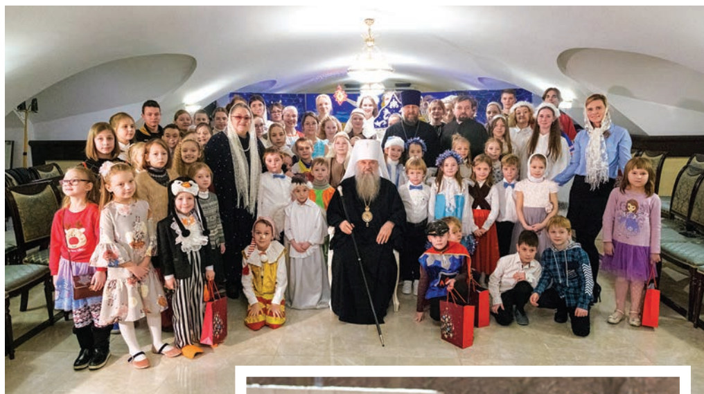
На празднике детской воскресной школы, 2022