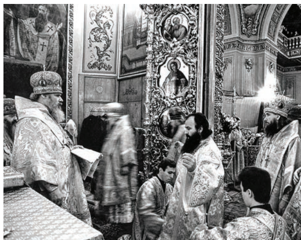
Хиротония во епископа