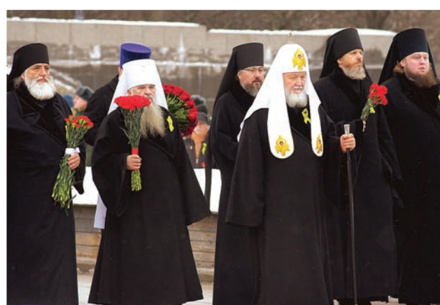
На Пискаревском кладбище, 2024