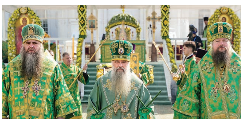
Божественная литургия в Дивеево, 2021