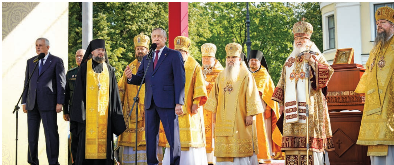
Молебен на площади Александра Невского, 2024