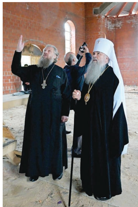
В строящемся храме свт. Тихона, Патриарха Московского