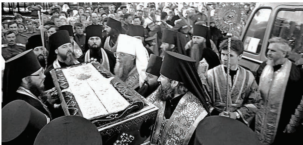
Второе обретение мощей прп. Серафима Саровского