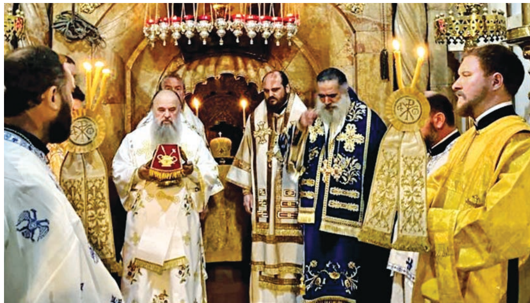
Божественная литургия на Гробе Господнем, 2022