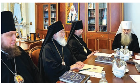
Заседание архиерейского совета митрополии, 2025