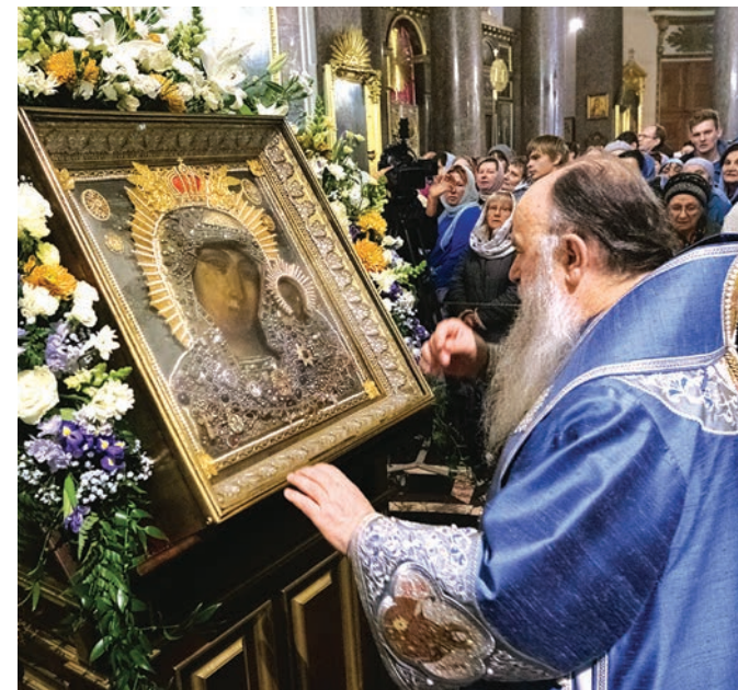
«Заступнице усердная...», 2020