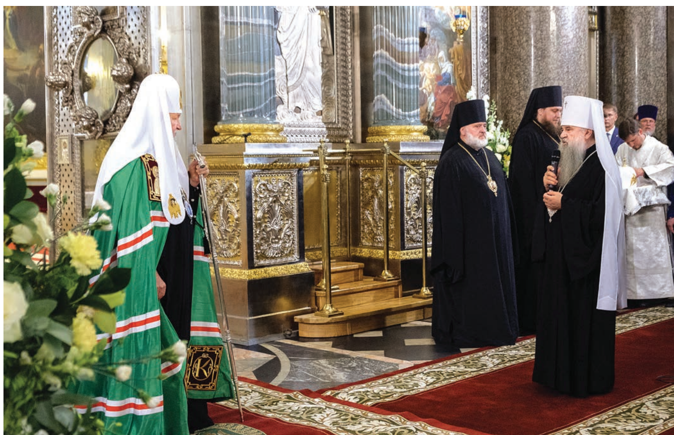
В Казанском кафедральном соборе, 2019