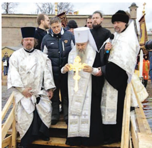
Освящение невских вод, 2020