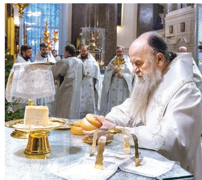
«Помяни, Господи, богохранимую страну нашу и православных людей ея», 2025