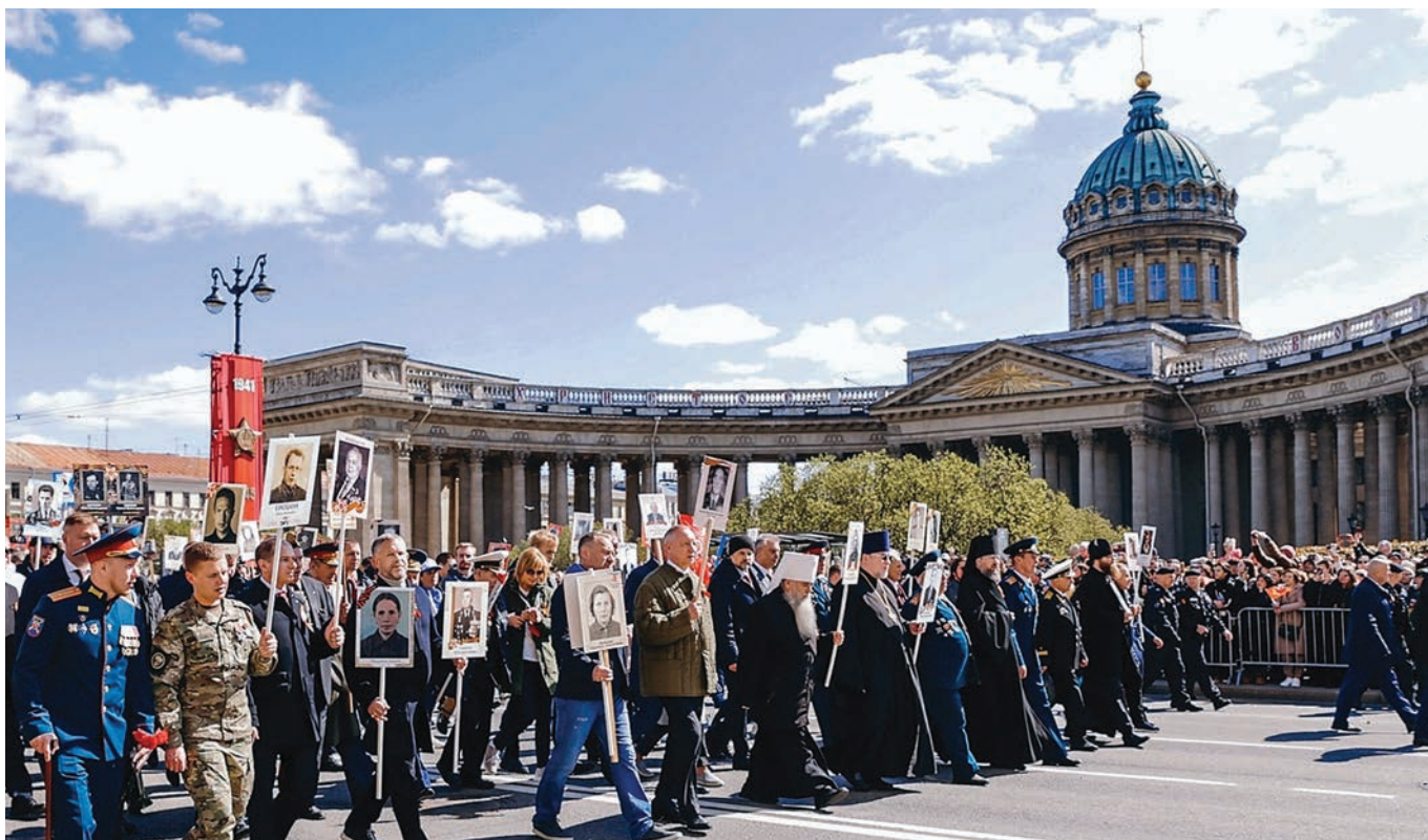
Шествие бессмертного полка, 2025