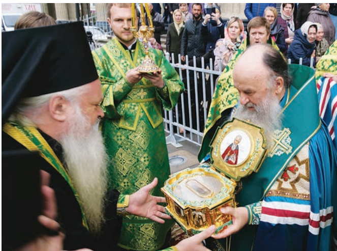
Встреча мощей прп. Сергия Радонежского, 2022