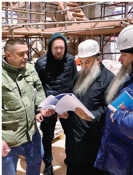
В восстанавливаемом храме иконы Божией Матери «Милующая»