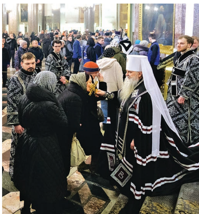
Чин прощения, 2025