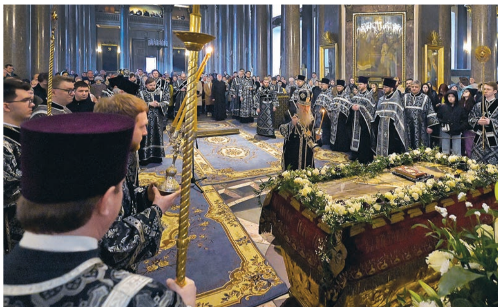
Утренняя Великой субботы с чином погребения Спасителя. Казанский кафедральный собор