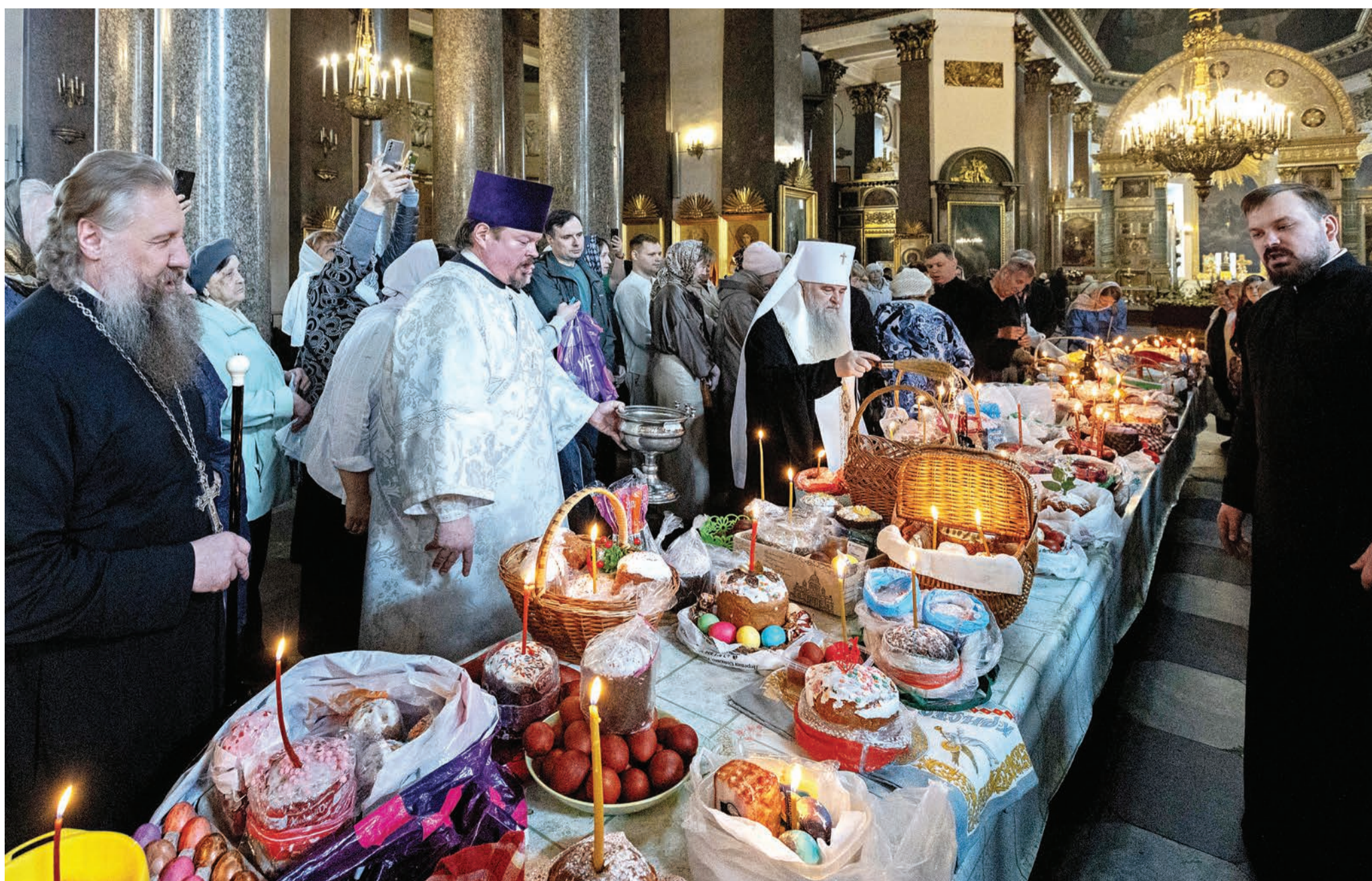
Великая суббота. Освящение куличей. Казанский кафедральный собор