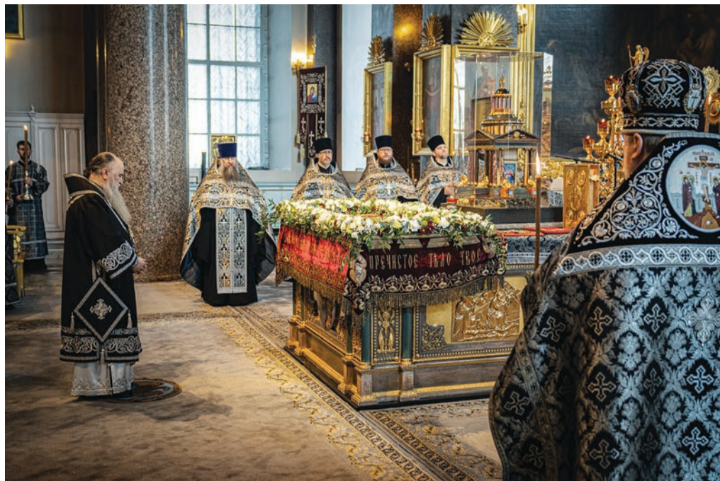
Великая пятница. Вечерня с выносом плащаницы. Казанский кафедральный собор