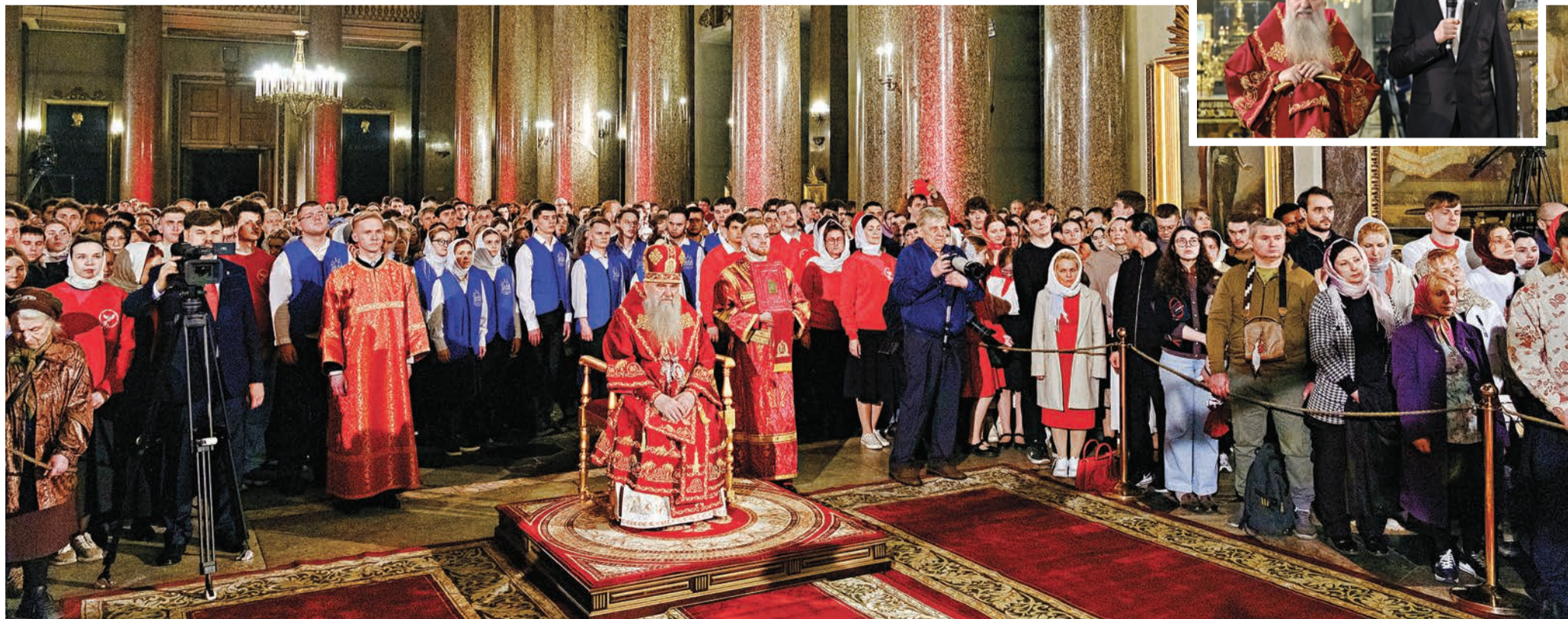
Пасха Христова. Ночное праздничное богослужение. Казанский кафедральный собор