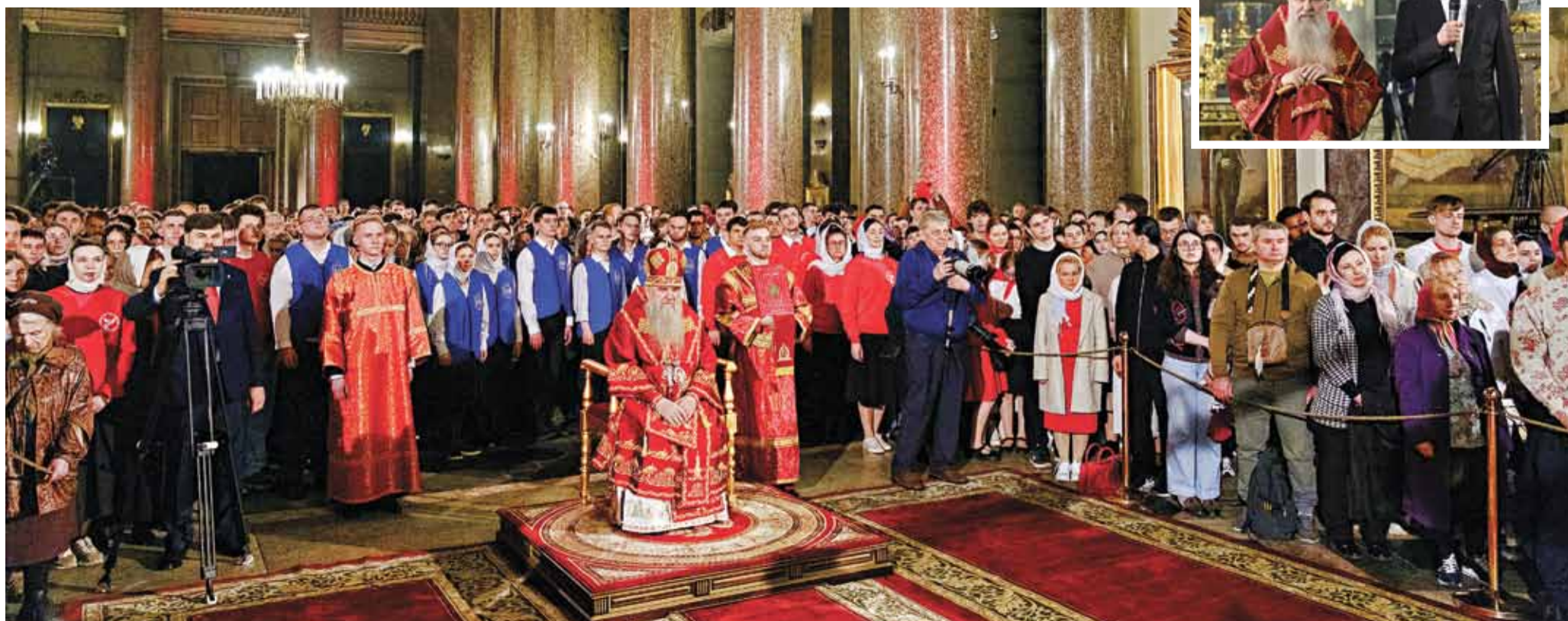
Пасха Христова. Ночное праздничное богослужение. Казанский кафедральный собор