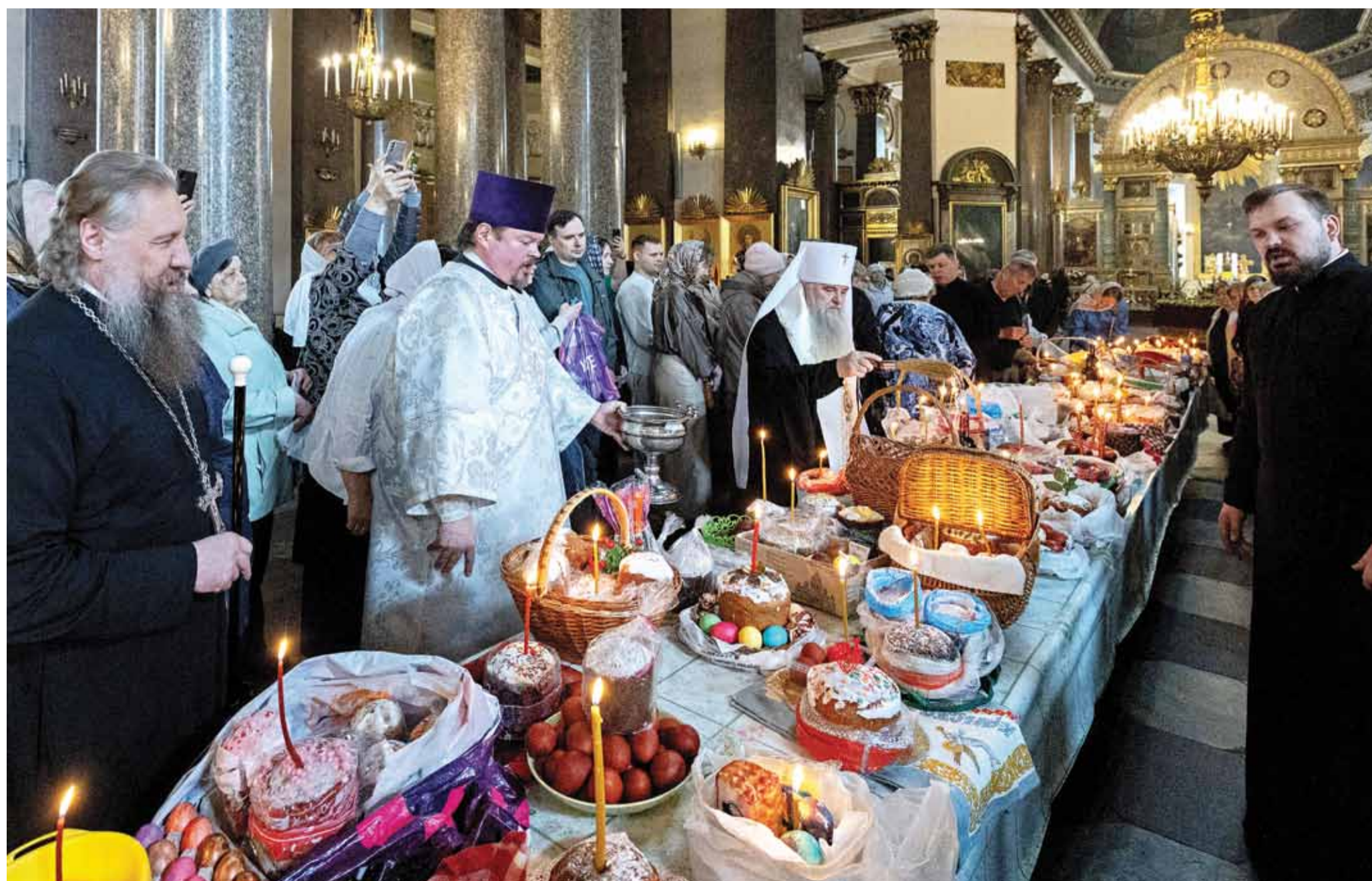
Великая суббота. Освящение куличей. Казанский кафедральный собор