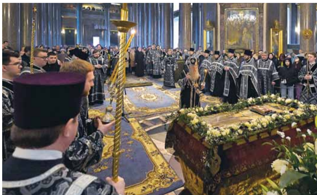
Утренняя Великой субботы с чином погребения Спасителя. Казанский кафедральный собор