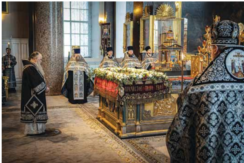
Великая пятница. Вечерня с выносом плащаницы. Казанский кафедральный собор