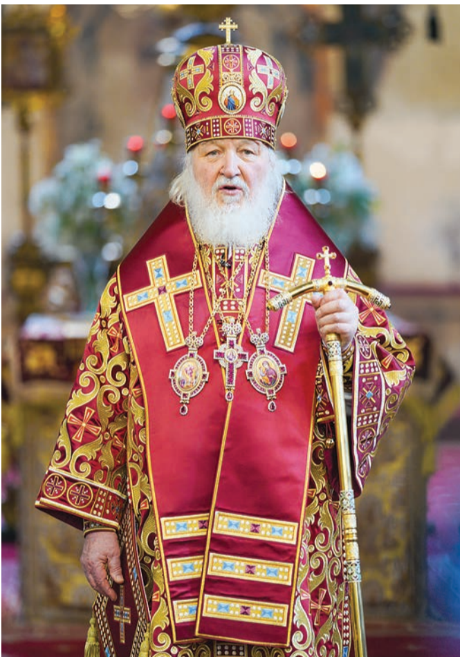
Святейший Патриарх Кирилл

Пусть Господь поможет всем нам вынести правильные уроки из нашей истории. И самый главный урок: мы живы и будем жить, пока мы верим в Бога, пока мы верны Ему и пока мы пытаемся, несмотря на множество сложных и непредсказуемых обстоятельств, устроить свою жизнь в соответствии с Божиим нравственным законом. Пусть способность людей на героизм – вплоть до посвящения своей жизни, отдачу своей жизни за ближних своих, за Отечество свое, за веру – никогда не покидает наш народ. И тогда он по-настоящему будет непобедим. Пусть Господь хранит Отечество наше, Церковь нашу и каждого из нас от всего того, что может разрушить целостность личности, общества и государства. С праздником Победы, с праздником Святой Пасхи! Христос Воскресе!