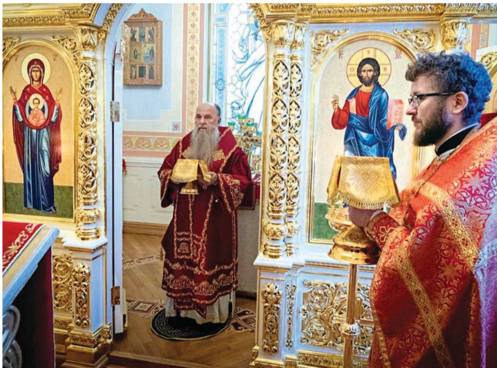
В домовом храме Тихвинской иконы Божией Матери резиденции петербургских митрополитов