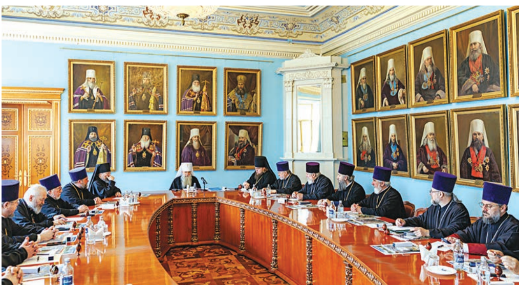
Заседание епархиального совета с участием благочинных