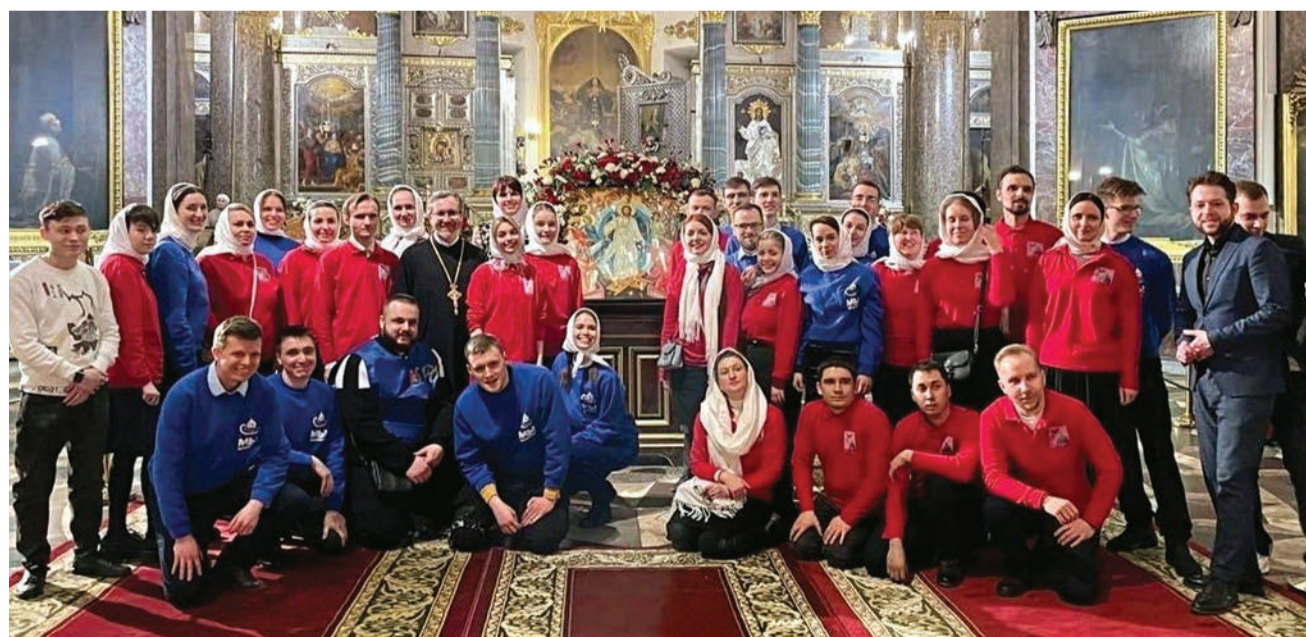
Праздник святых жен-мироносиц. Перед причастием в алтаре Казанского собора