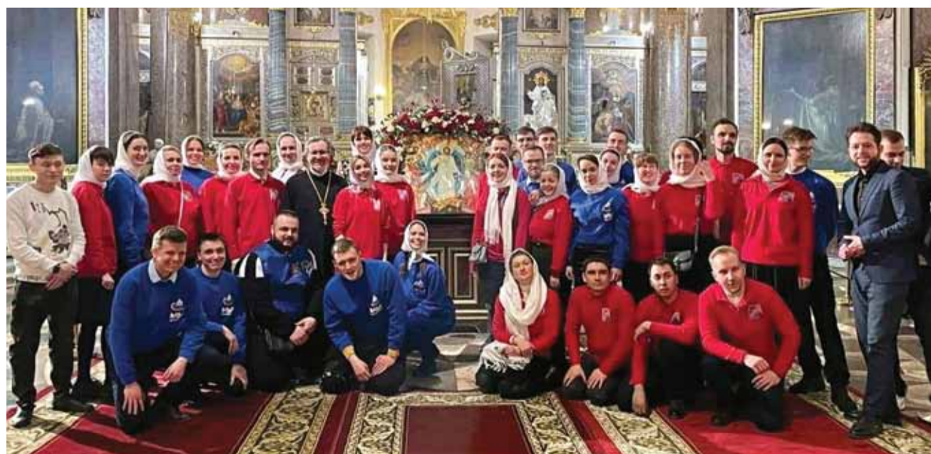
Праздник святых жен-мироносиц. Перед причастием в алтаре Казанского собора