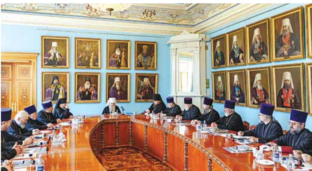
Заседание епархиального совета с участием благочинных