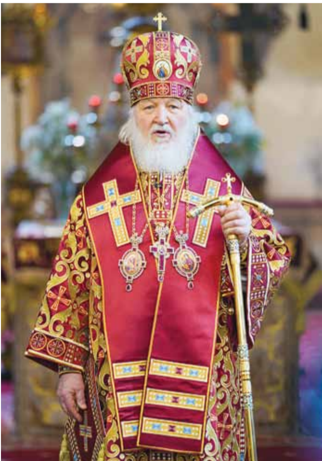
Святейший Патриарх Кирилл

Пусть Господь поможет всем нам вынести правильные уроки из нашей истории. И самый главный урок: мы живы и будем жить, пока мы верим в Бога, пока мы верны Ему и пока мы пытаемся, несмотря на множество сложных и непредсказуемых обстоятельств, устроить свою жизнь в соответствии с Божиим нравственным законом. Пусть способность людей на героизм – вплоть до посвящения своей жизни, отдачу своей жизни за ближних своих, за Отечество свое, за веру – никогда не покидает наш народ. И тогда он по-настоящему будет непобедим. Пусть Господь хранит Отечество наше, Церковь нашу и каждого из нас от всего того, что может разрушить целостность личности, общества и государства. С праздником Победы, с праздником Святой Пасхи! Христос Воскресе!