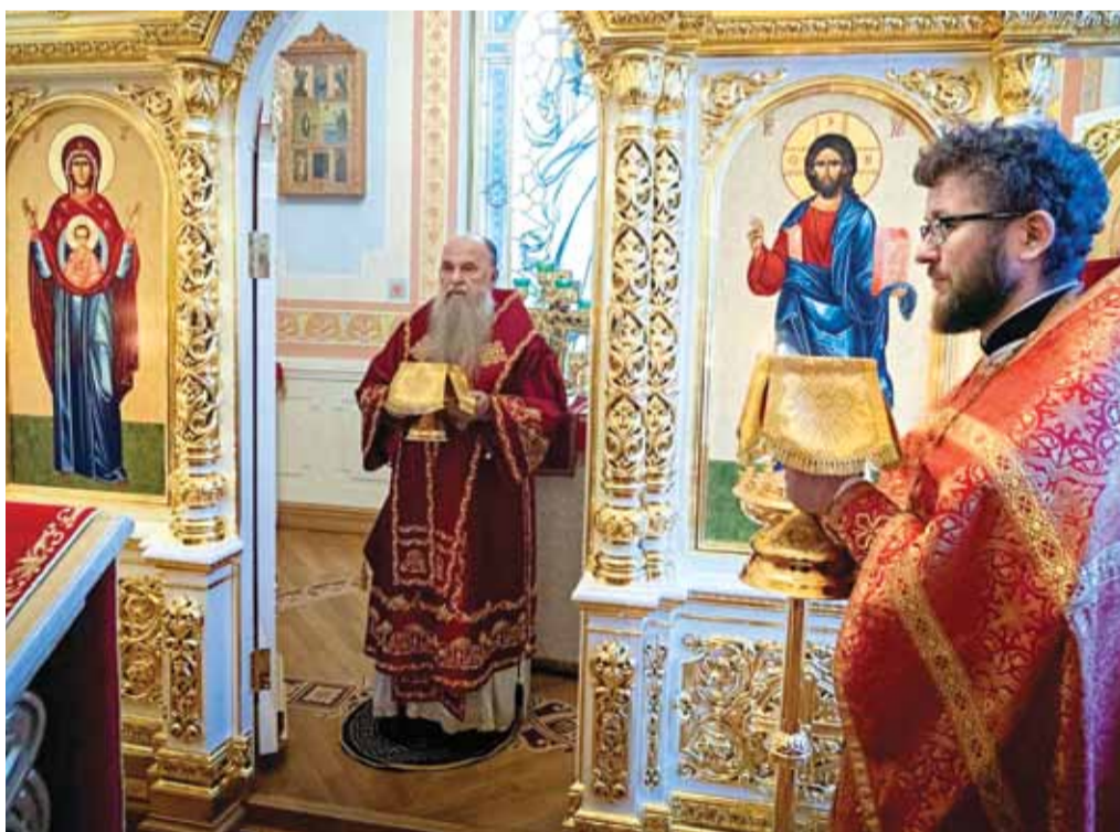
В домовом храме Тихвинской иконы Божией Матери резиденции петербургских митрополитов