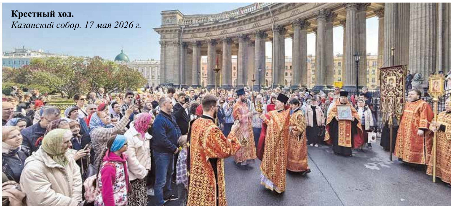
Крестный ход. Казанский собор. 17 мая 2026 г.

Заказать требы в Казанском кафедральном соборе