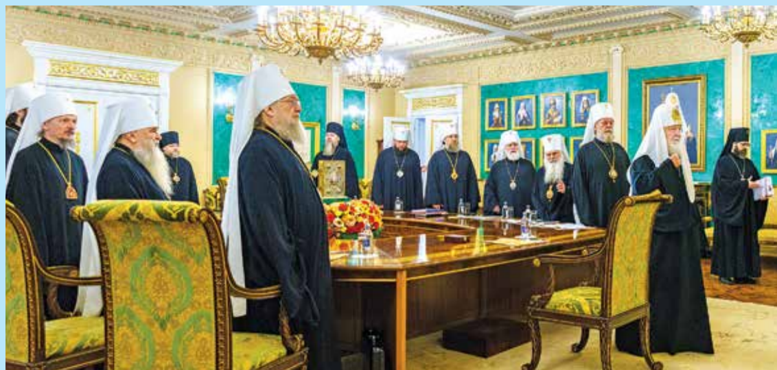
Митрополит Санкт-Петербургский и Ладожский Варсонофий принял участие в заседании Священного Синода, состоявшемся 14 мая 2026 года в Патриаршей и Синодальной резиденции в Даниловом монастыре под председательством Святейшего Патриарха Кирилла.